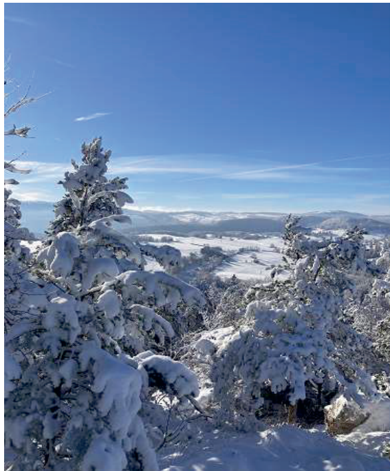
Traumhafter Ausblick Habschälle

Berichte und Informationen aus dem Gemeinderat, der Gemeindeverwaltung, der Vereine und der Bevölkerung