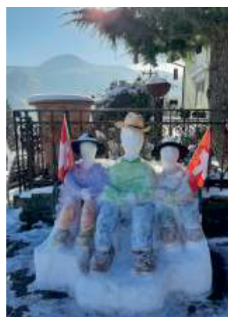
Drei Schneefiguren – von Urs Waser