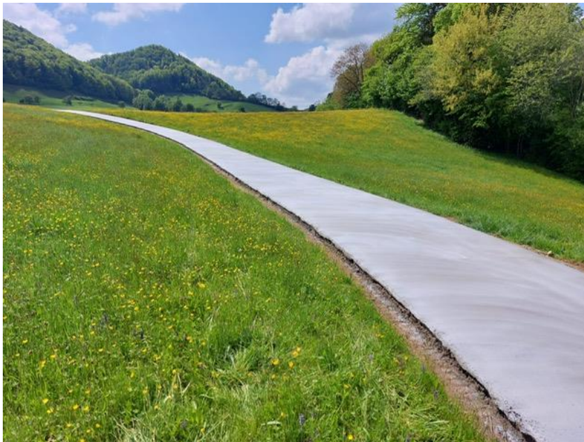
Die neuen Hofzufahrten Spitzenbühl und Rohrberg – mehr dazu siehe Seite 4

Berichte und Informationen aus dem Gemeinderat, der Gemeindeverwaltung, der Vereine und der Bevölkerung